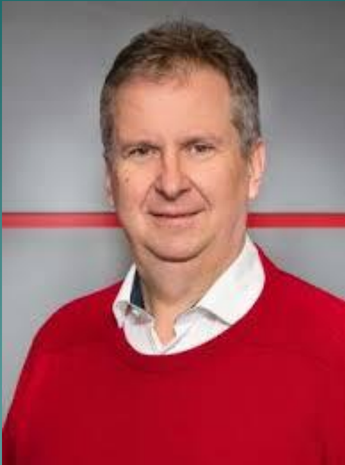
okl. építőmérnök, ügyv. ig., PBE Kft.