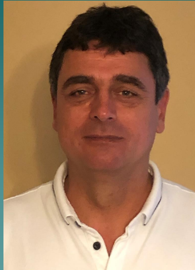
okl. építőmérnök, területi ig., WHB Kft.